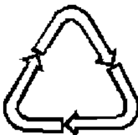
Рисунок 4 - возможность утилизации использованной упаковки (укупорочных средств) - петля Мебиуса